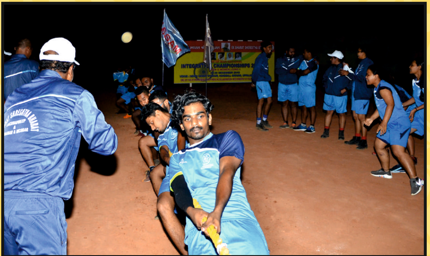
Rope Pull by Men Team of Lakshadweep & Andaman & Nicobar