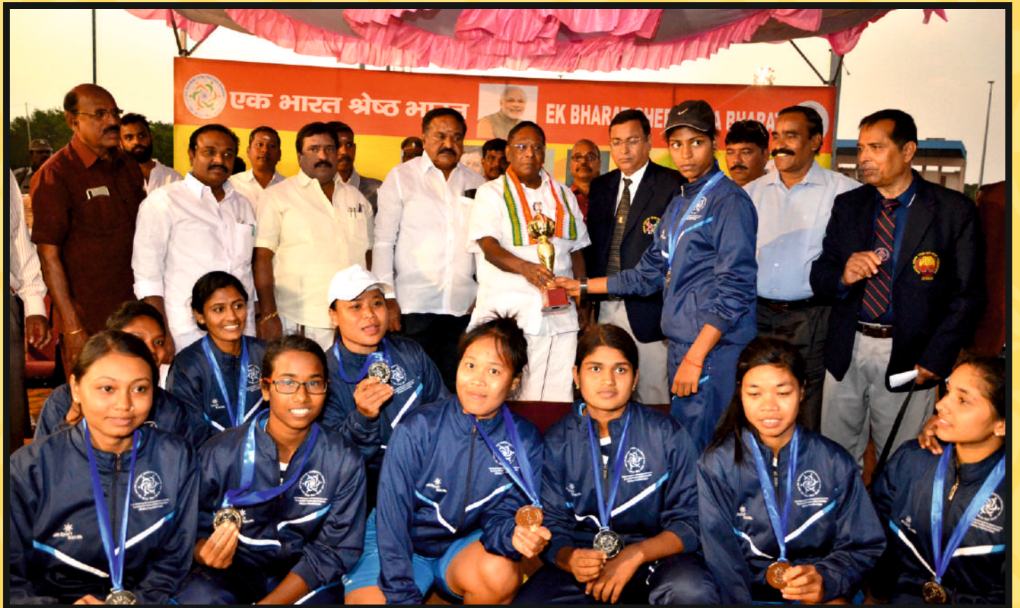
Hon'ble Chief Minister, Govt. of Puducherry Shri V.NARAYANASAMY Presented the Runner-Up Trophy to Women Team of Lakshdweep & Andaman & Nicobar UT