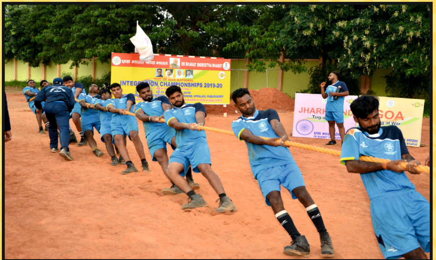
Rope Pull by Men Team of Goa & Jharkhand Vs. Punjab & AP in Final