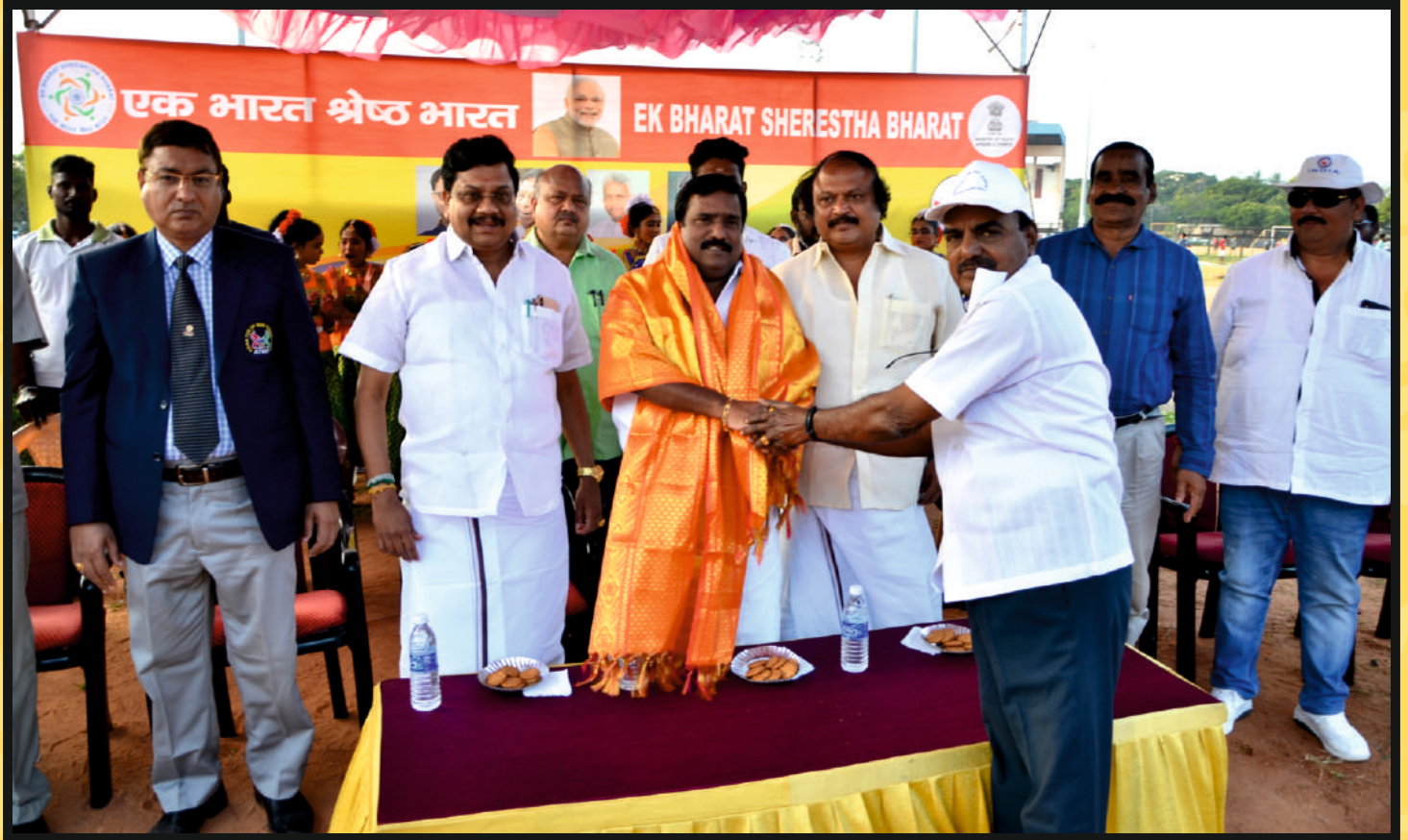
Hon'ble Chief Guest Shri R. Shiva, MLA, Legislative Assembly of Puducherry, receiving welcome of TWFI