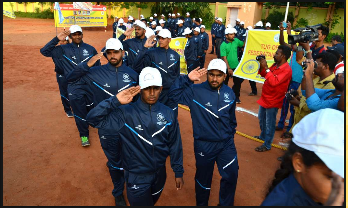
March-Past Goa-Jharkhand Team