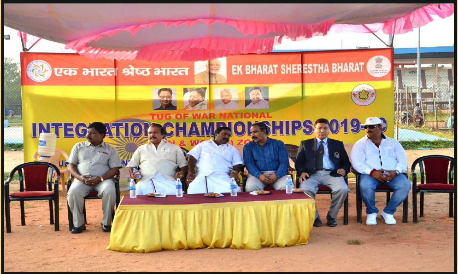
Photo shows a section of VIP stands