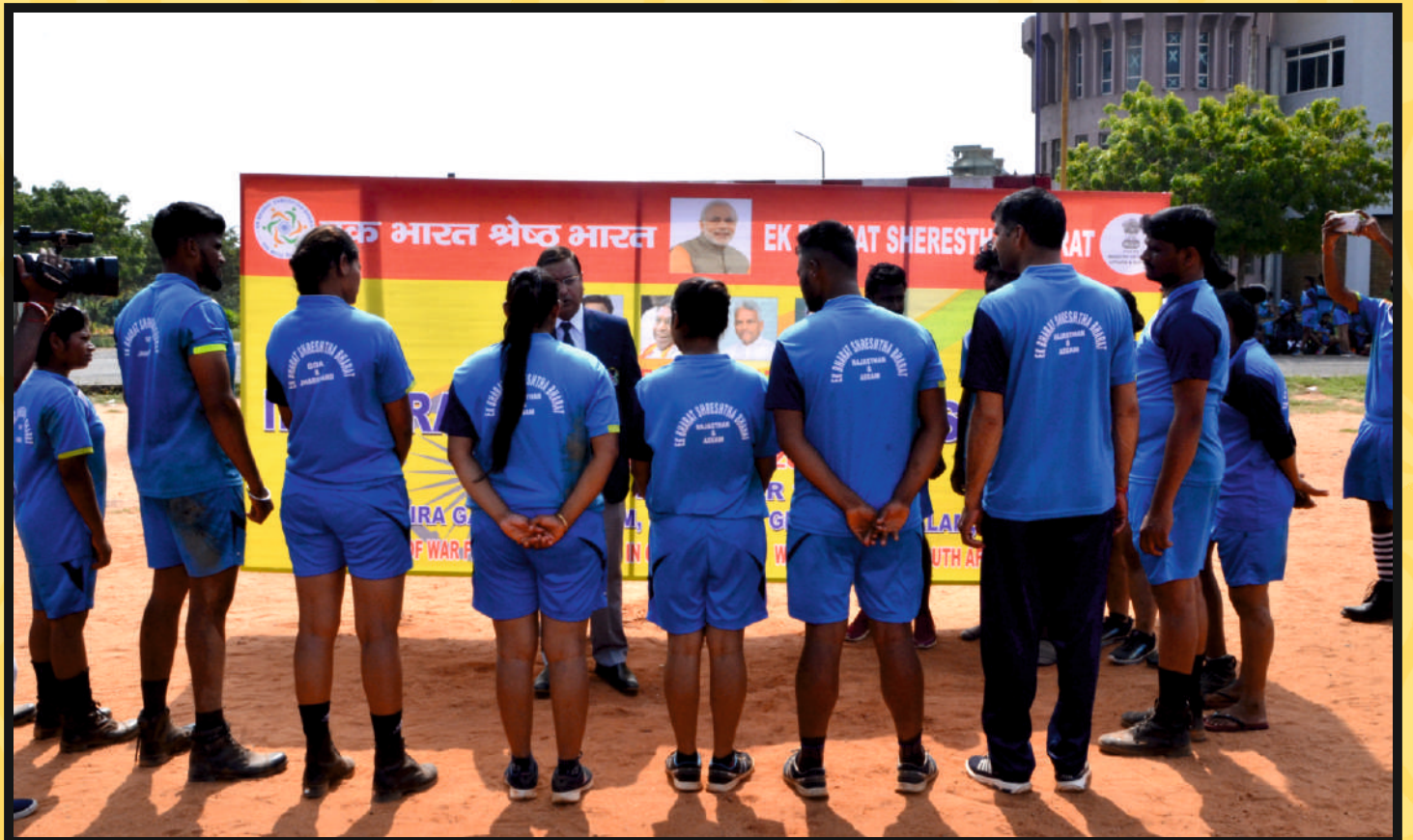
Part view of the Publicity in Sports-Kit