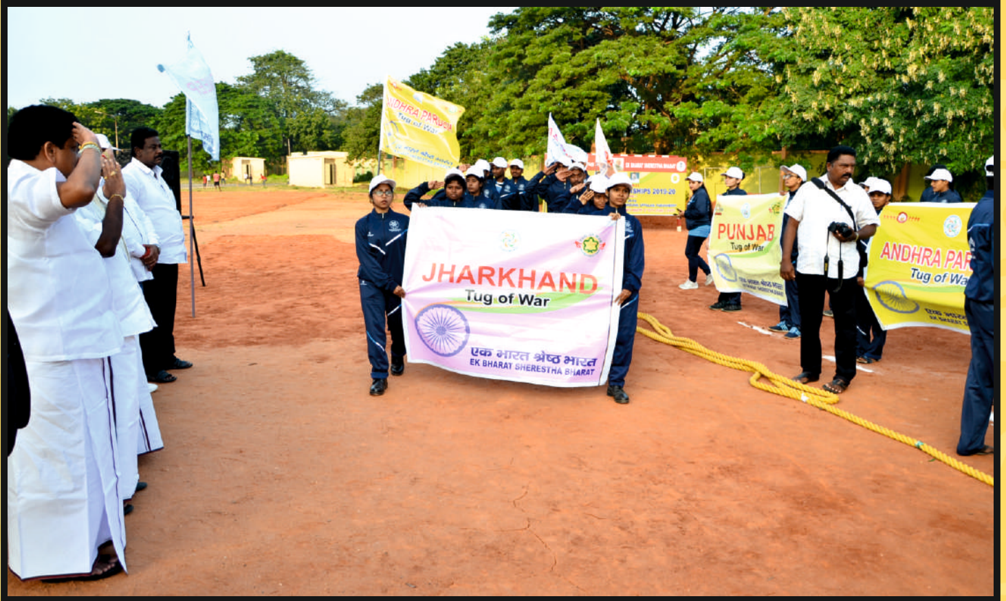
March-Past Salute by Chief Guest Shri R. Shiva, MLA, Legislative Assembly of Puducherry