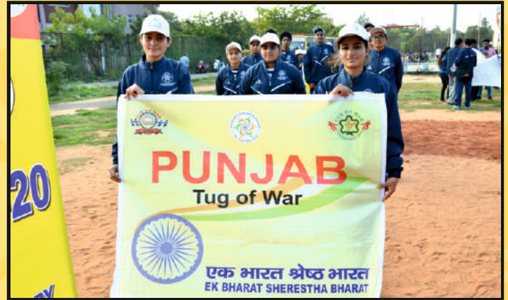
Part view of the Teams Players with Flag