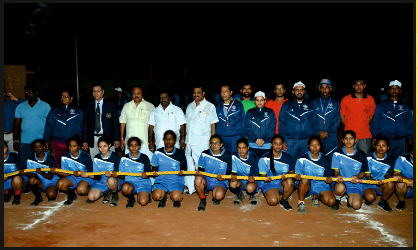
Group photo of with (Center in) Hon'ble Chief Guest Shri R. Shiva, MLA, Legislative Assembly of Puducherry