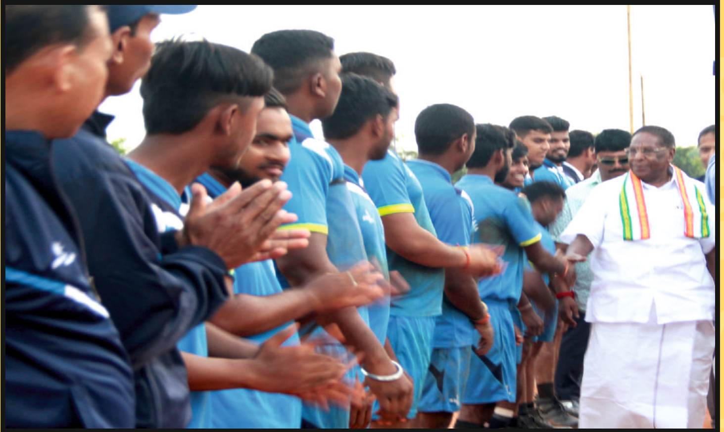
Hand shake with Goa & Jharkhand Men Team by Shri V.NARAYANASAMY Hon'ble Chief Minister, Govt. of Puducherry at Introduction time.