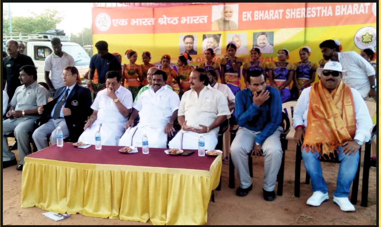
Photo shows a section of VIP stands