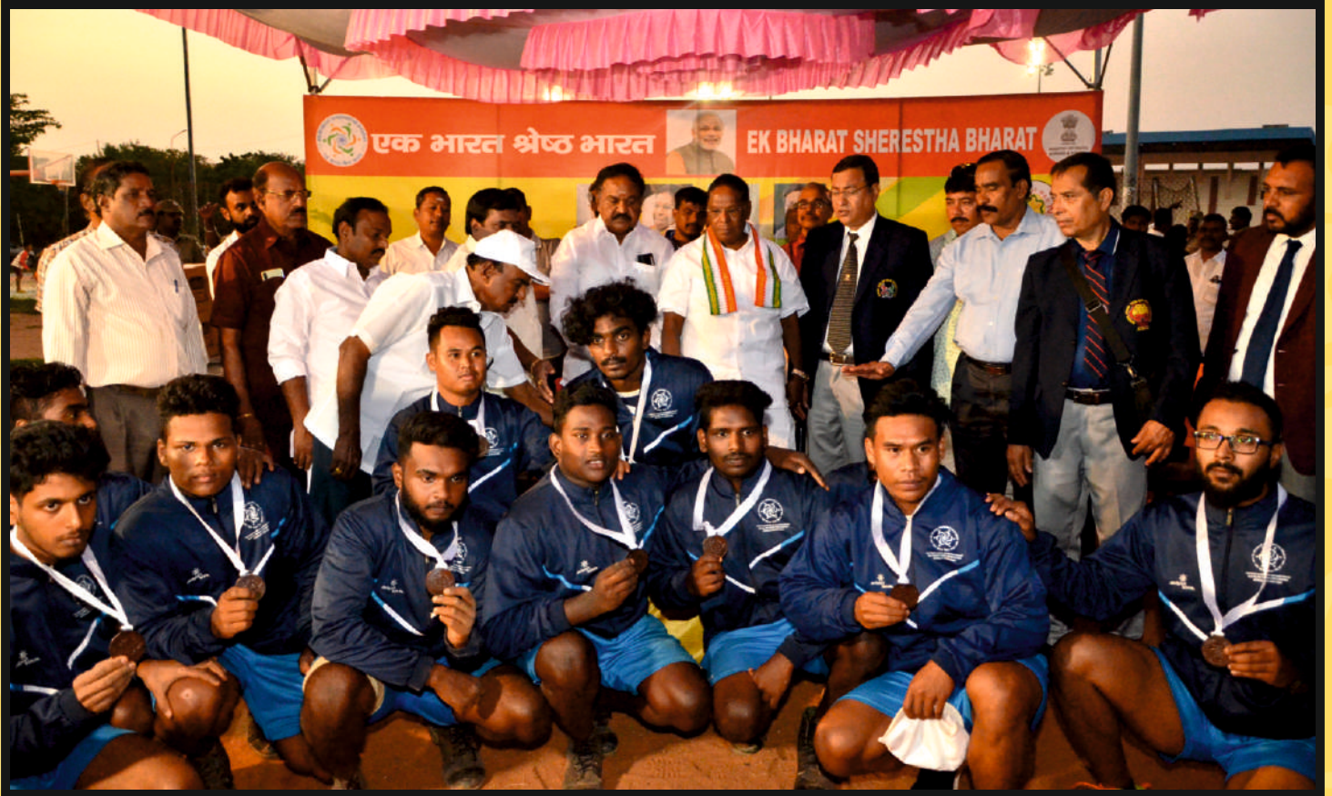
Group photo of Bronze Medal 3rd Place winner Men Team of Lakshadweep & Andaman & Nicobar UT with (Center in) Hon'ble Chief Minister, Govt. of Puducherry Shri V.NARAYANASAMY