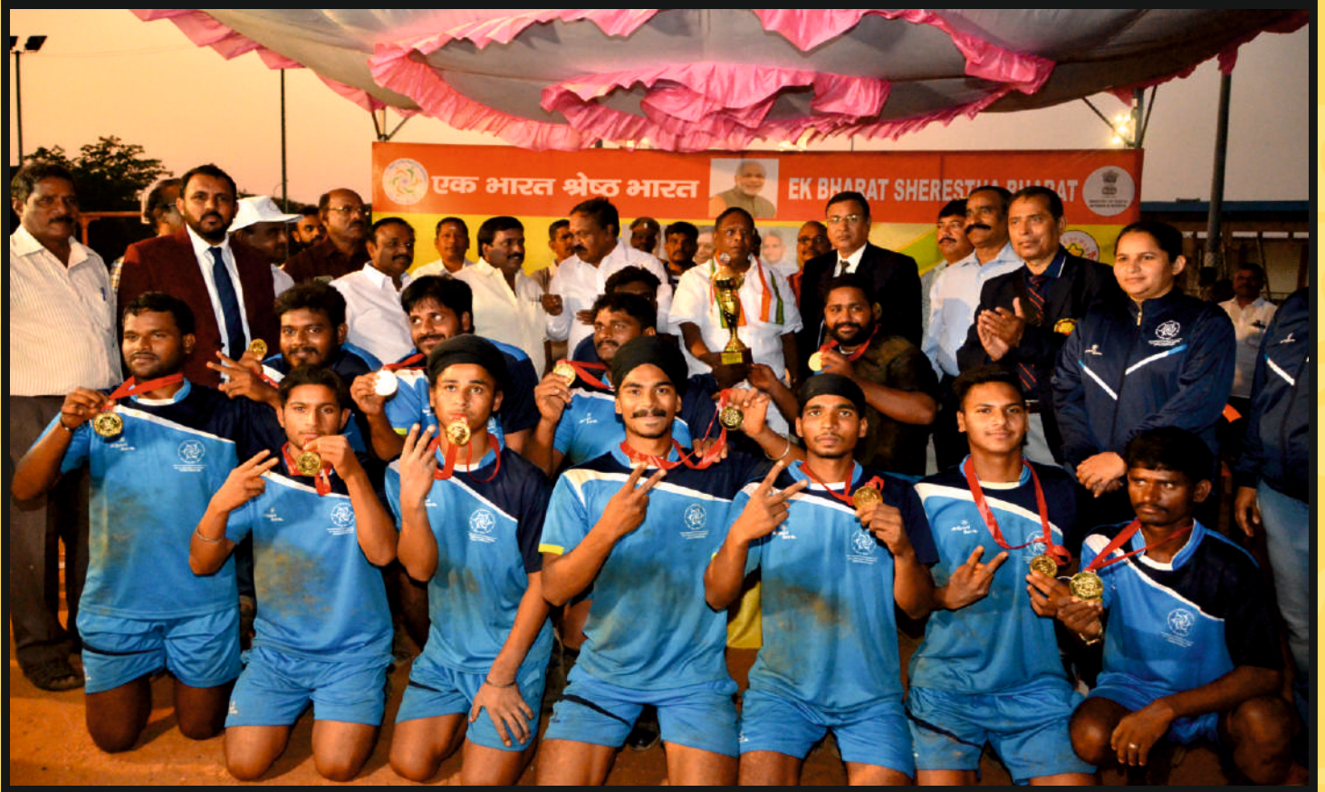
Hon'ble Chief Minister, Govt. of Puducherry Shri V.NARAYANASAMY Presented the Winner Trophy to Men Team of Punjab & Andhra Pradesh