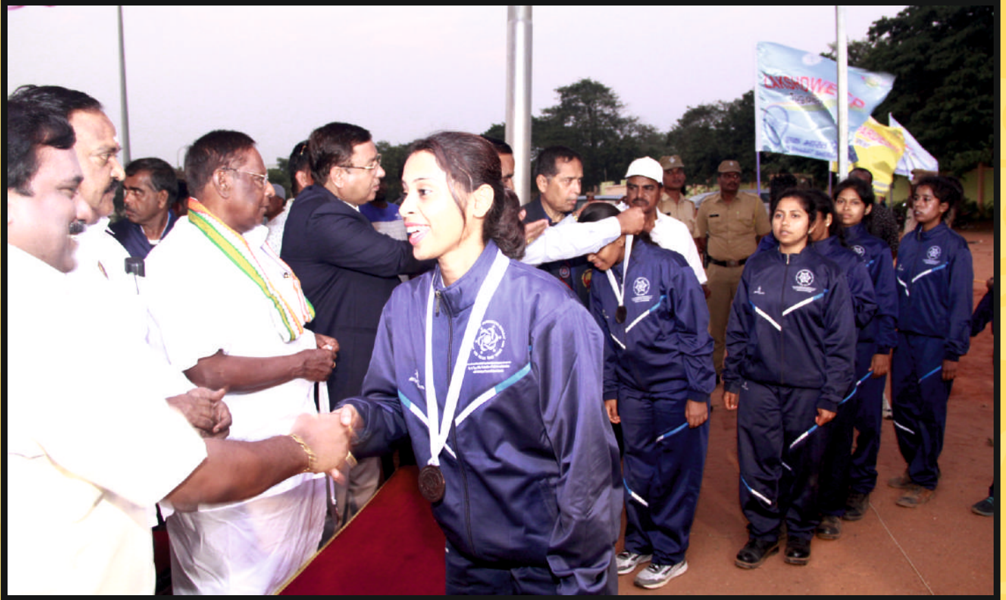
Group photo of Bronze Medal 3rd Place winner Women Team of Goa & Jharkhand with ( Center in) Hon'ble Chief Minister, Govt. of Puducherry Shri V.NARAYANASAMY