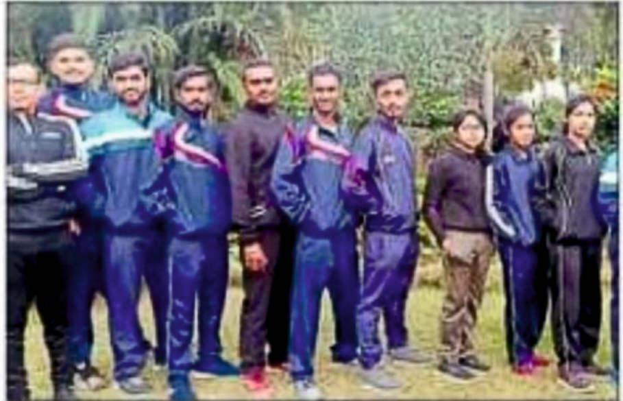
• The team to participate in the championship in Puducherry.

A 12 members boys and girls squads of Jharkhand on