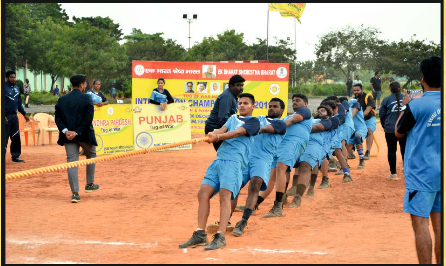
Rope Pull by Men Team of Punjab & AP Vs. Goa & Jharkhand in Final