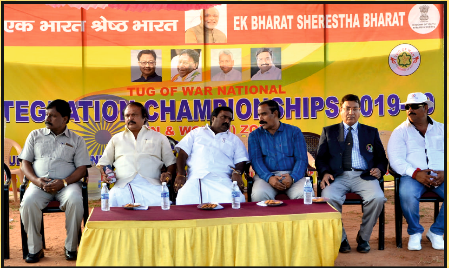
Photo shows a section of VIP stands