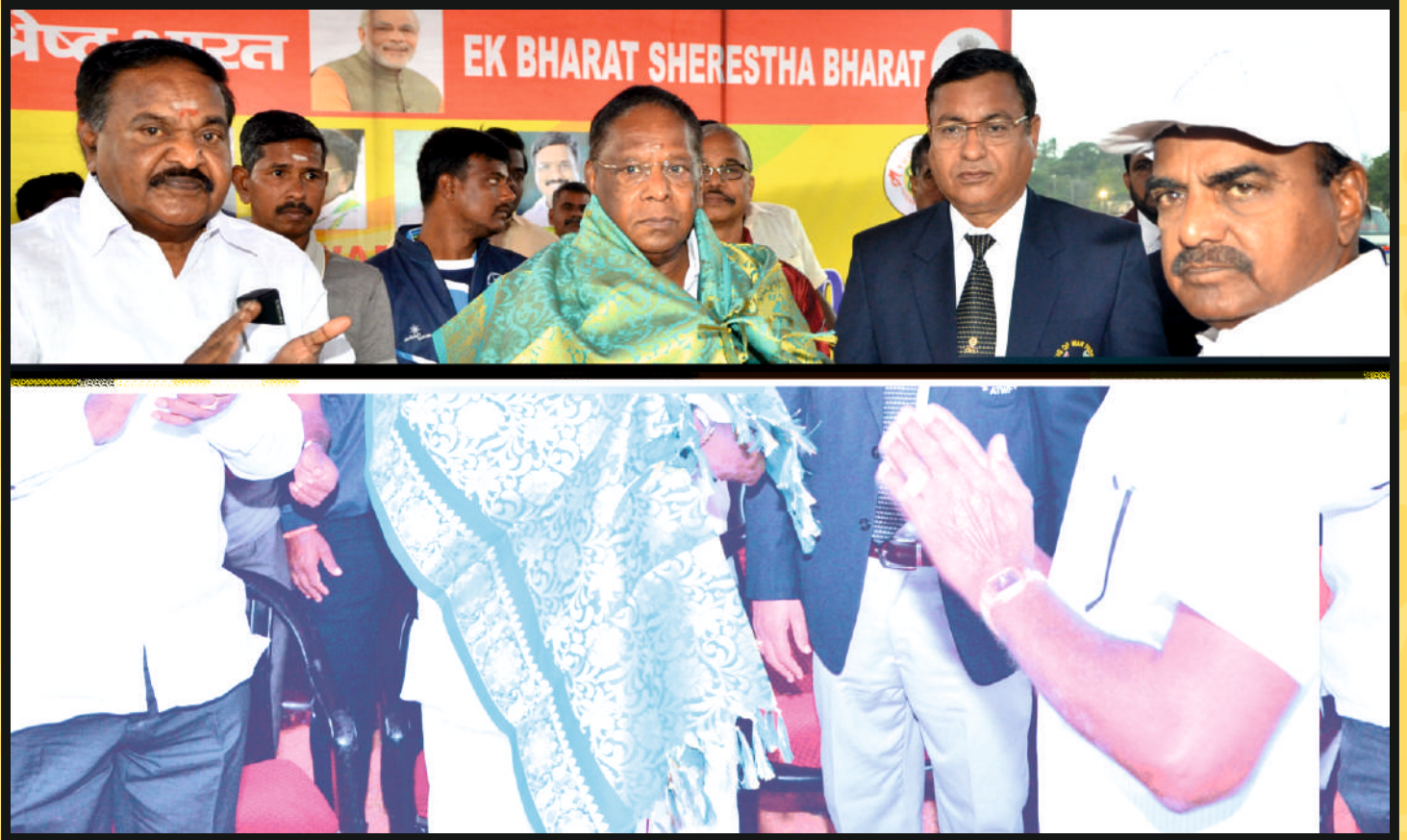
Hon'ble Chief Minister, Govt. of Puducherry Shri V.NARAYANASAMY, receiving welcome of TWF