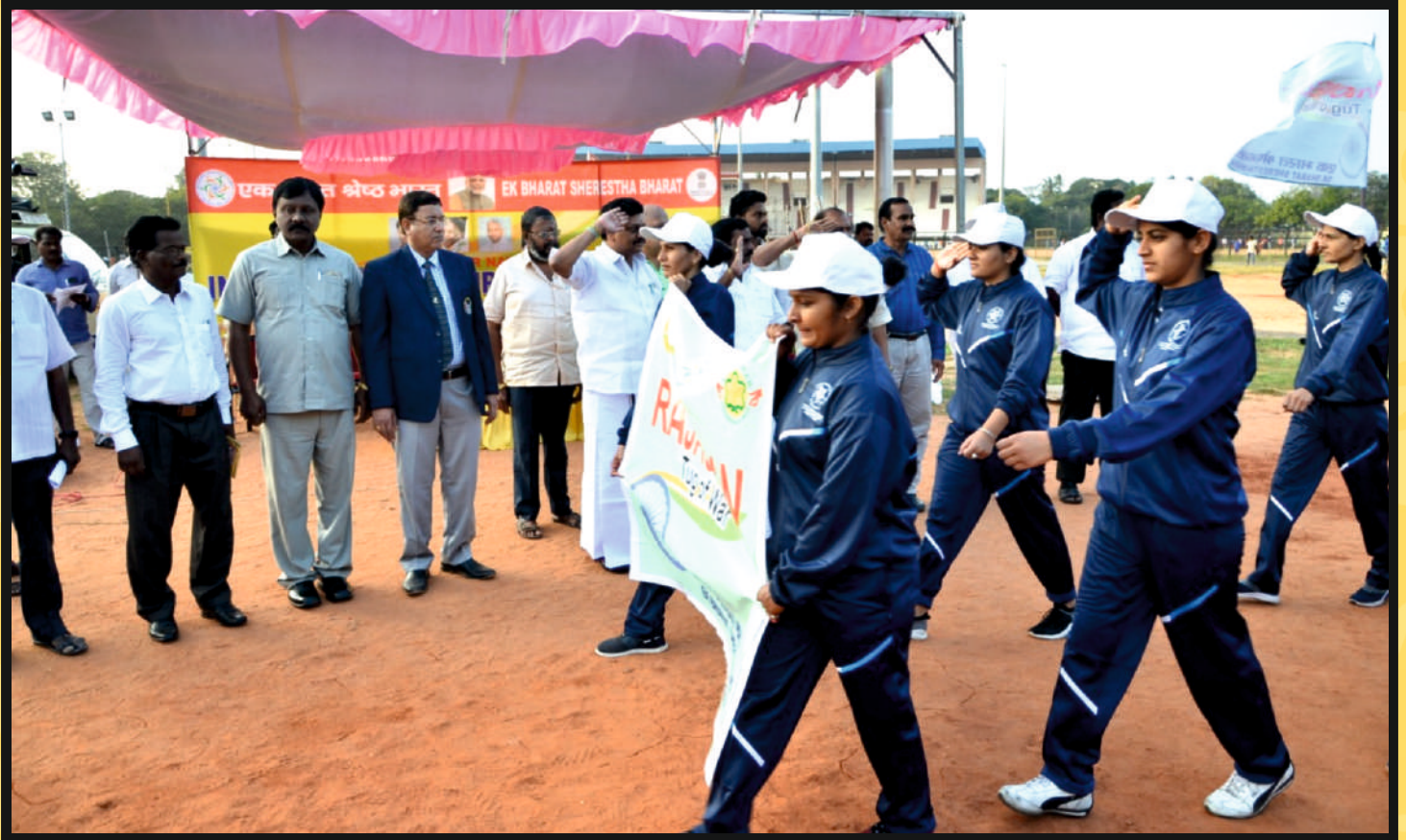
March-Past Rajasthan-Assam Team