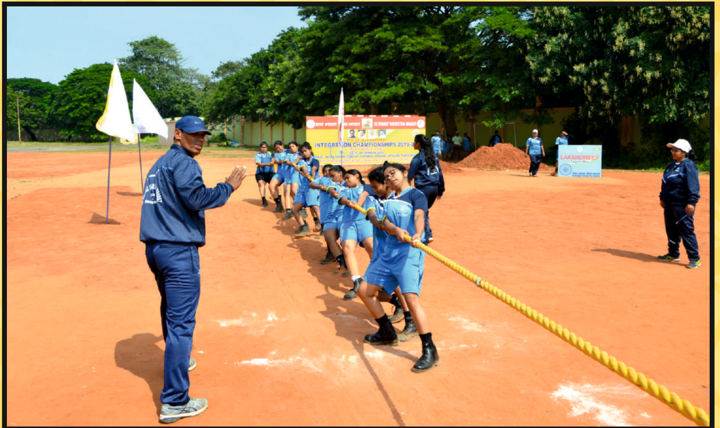
Rope Pull by Women Team of Goa & Jharkhand