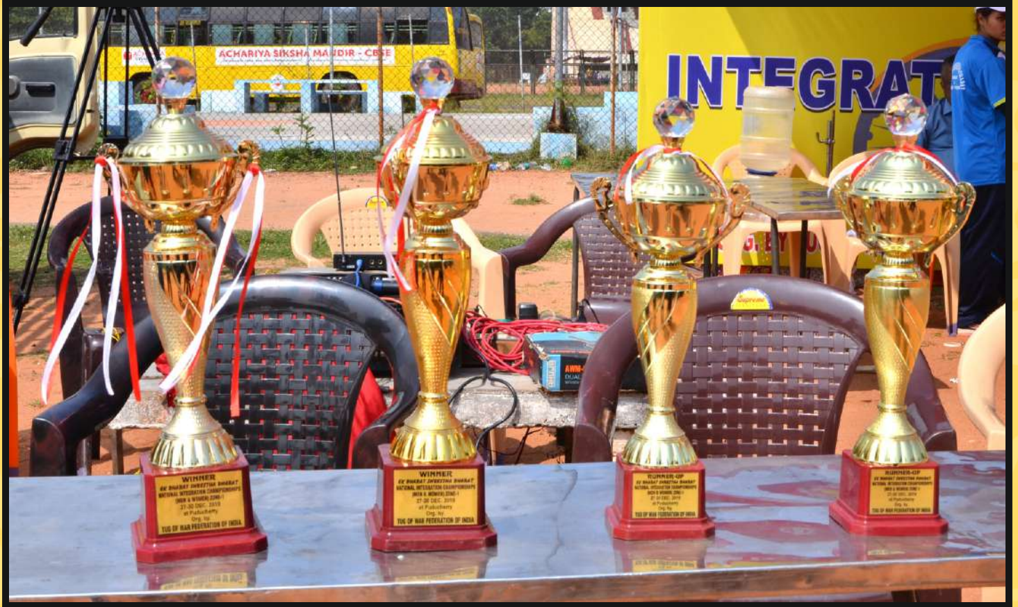
Winner Trophy's for Men Categories