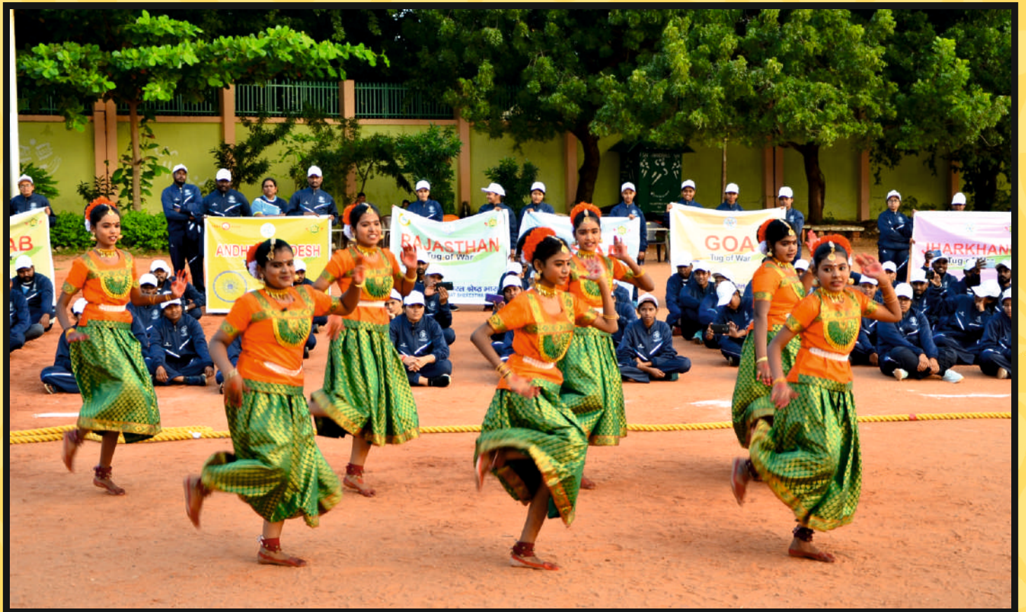
Presentation of Cultural Programme