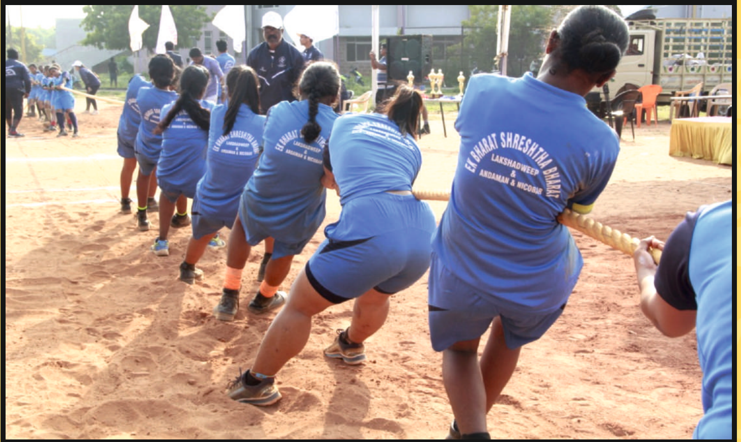
Part view of the Publicity in Sports-Kit