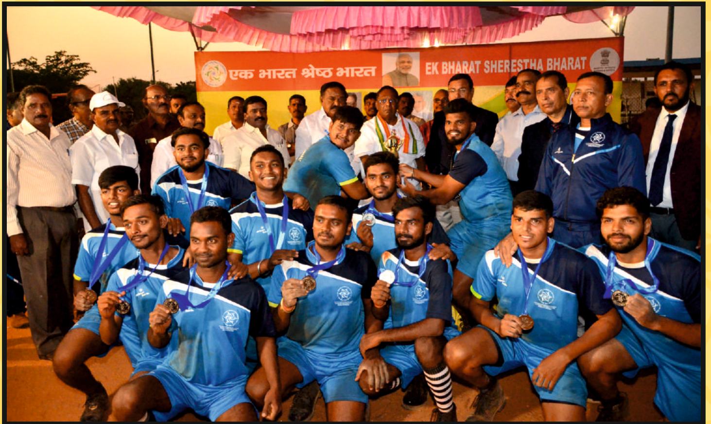
Hon'ble Chief Minister, Govt. of Puducherry Shri V.NARAYANASAMY Presented the Runner-Up Trophy to Men Team of Goa & Jharakhand