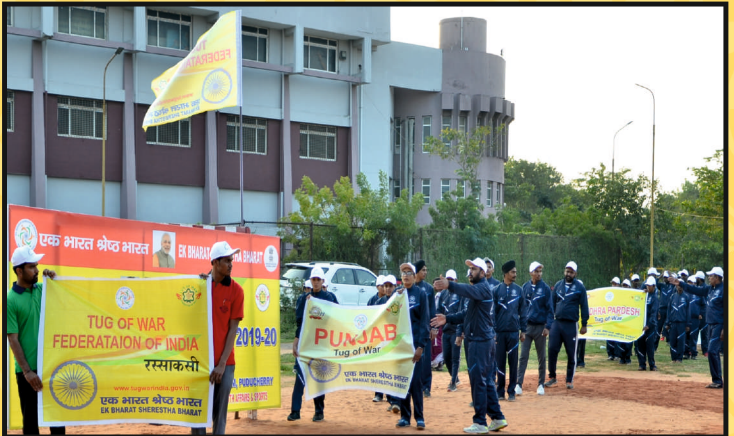
March-Past by Participants of Men Team