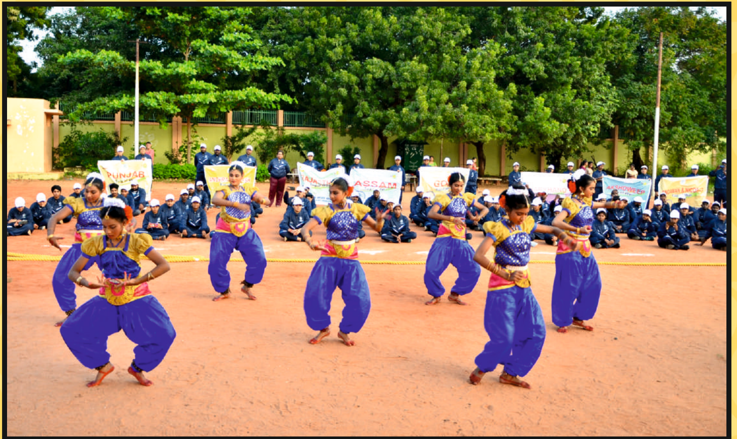
Presentation of Cultural Programme