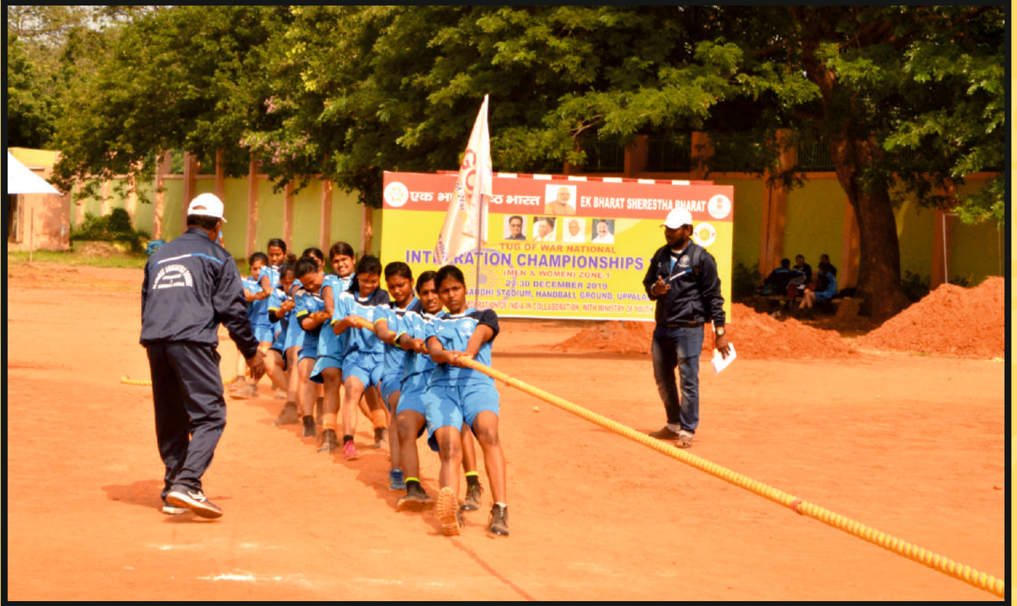
Rope Pull by Women Team of Lakshadweep with Andaman & Nicobar UT