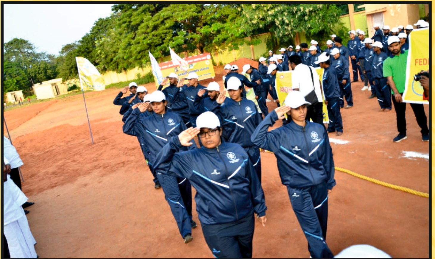
March-Past by Participants of Women Team