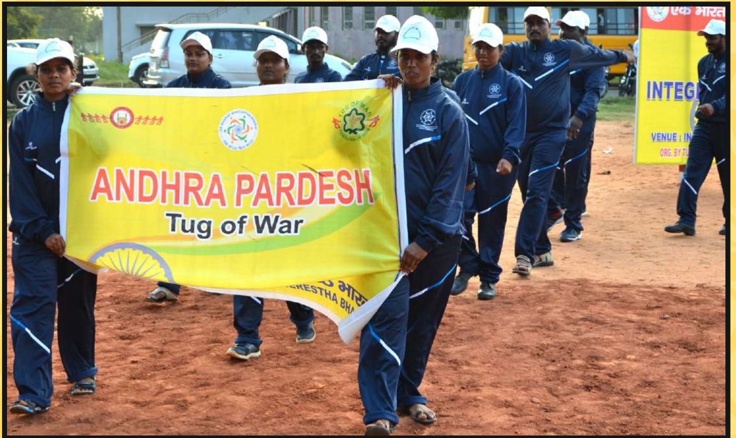
March-Past Continues by AP-Punjab team