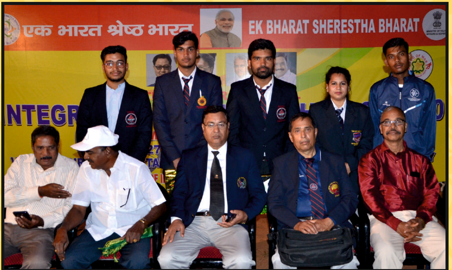
Group photo of TWFI Technical Staff at Puducherry