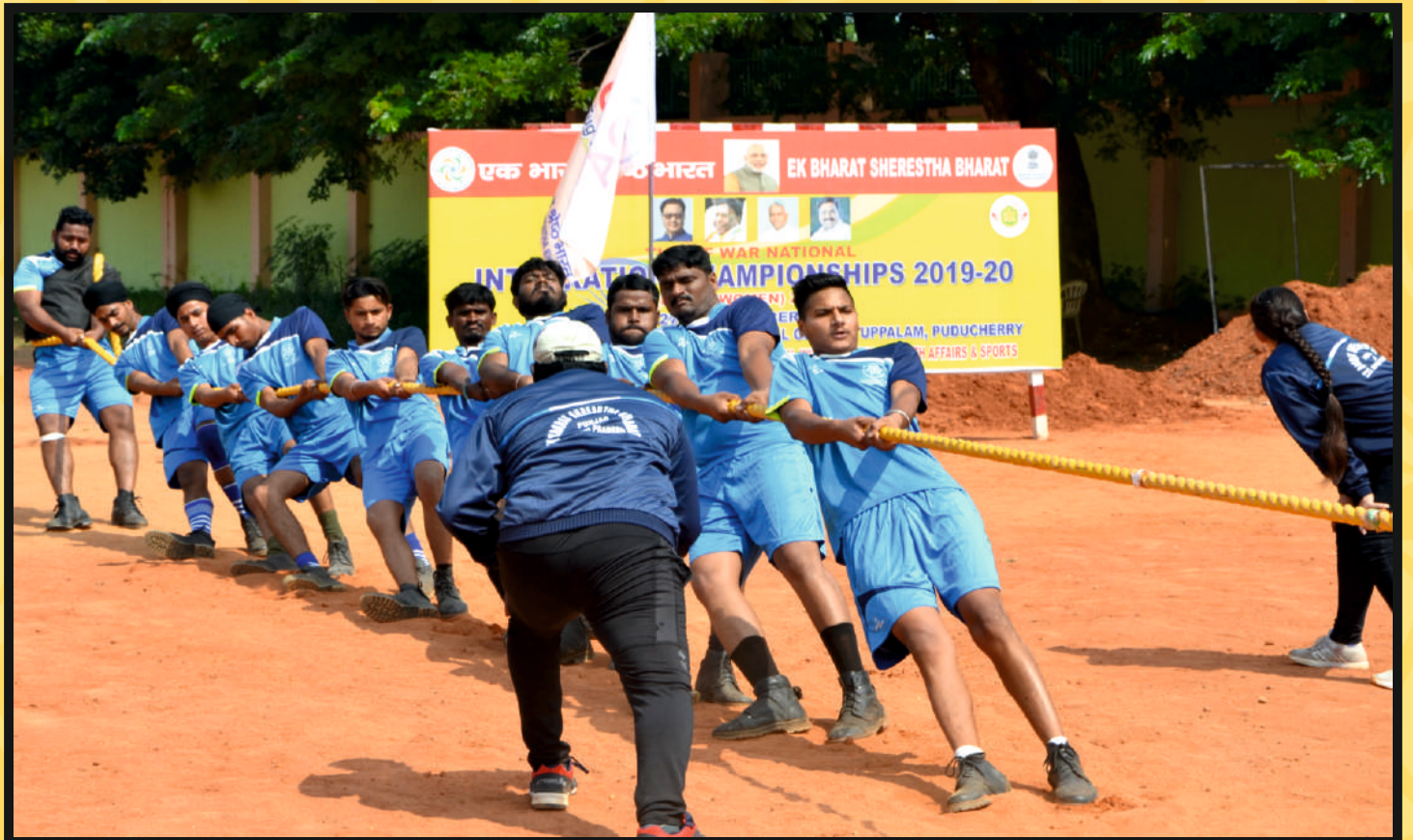
Rope Pull by Men Team of Punjab & AP