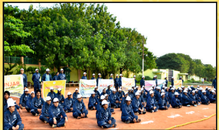
Part view of the Publicity in Sports-Kit & Track-Suits