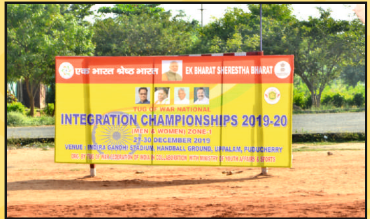
Part view of the Publicity Holding in the Arena