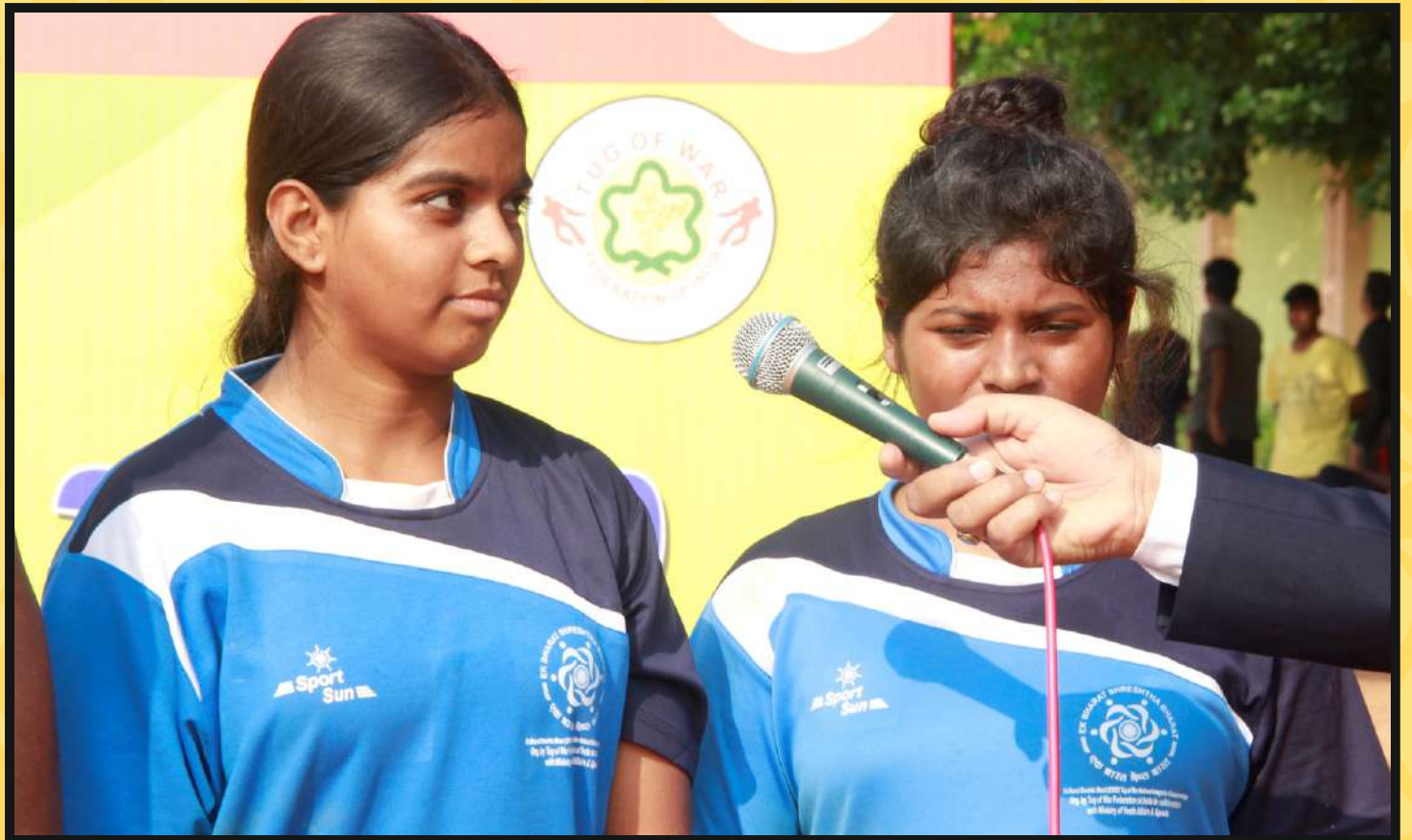
Part view of the Teams Players in Sports-Kit