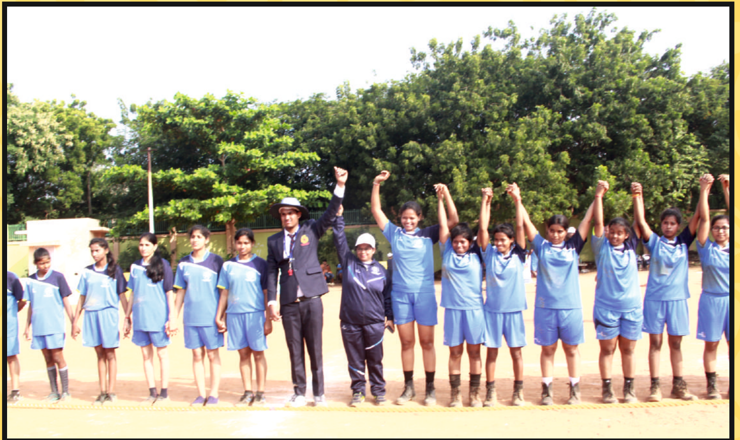
Picture shows Referee declare winning team of the Match L to R Rajasthan & Assam with Goa & Jharkhand