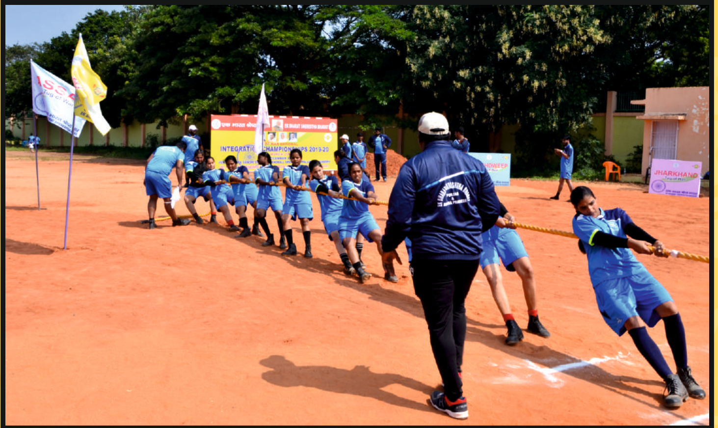
Rope Pull by Women Team of Punjab & AP