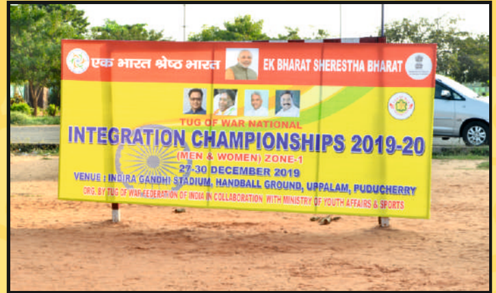
Part view of the Publicity Holding in the Arena