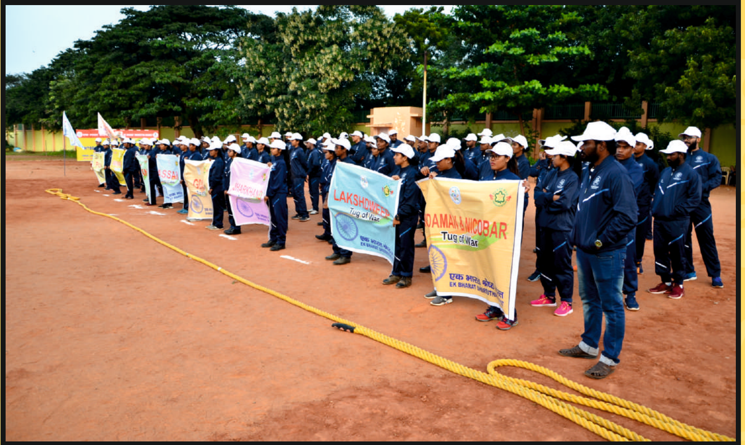
Part view of the Teams Players with State Banner