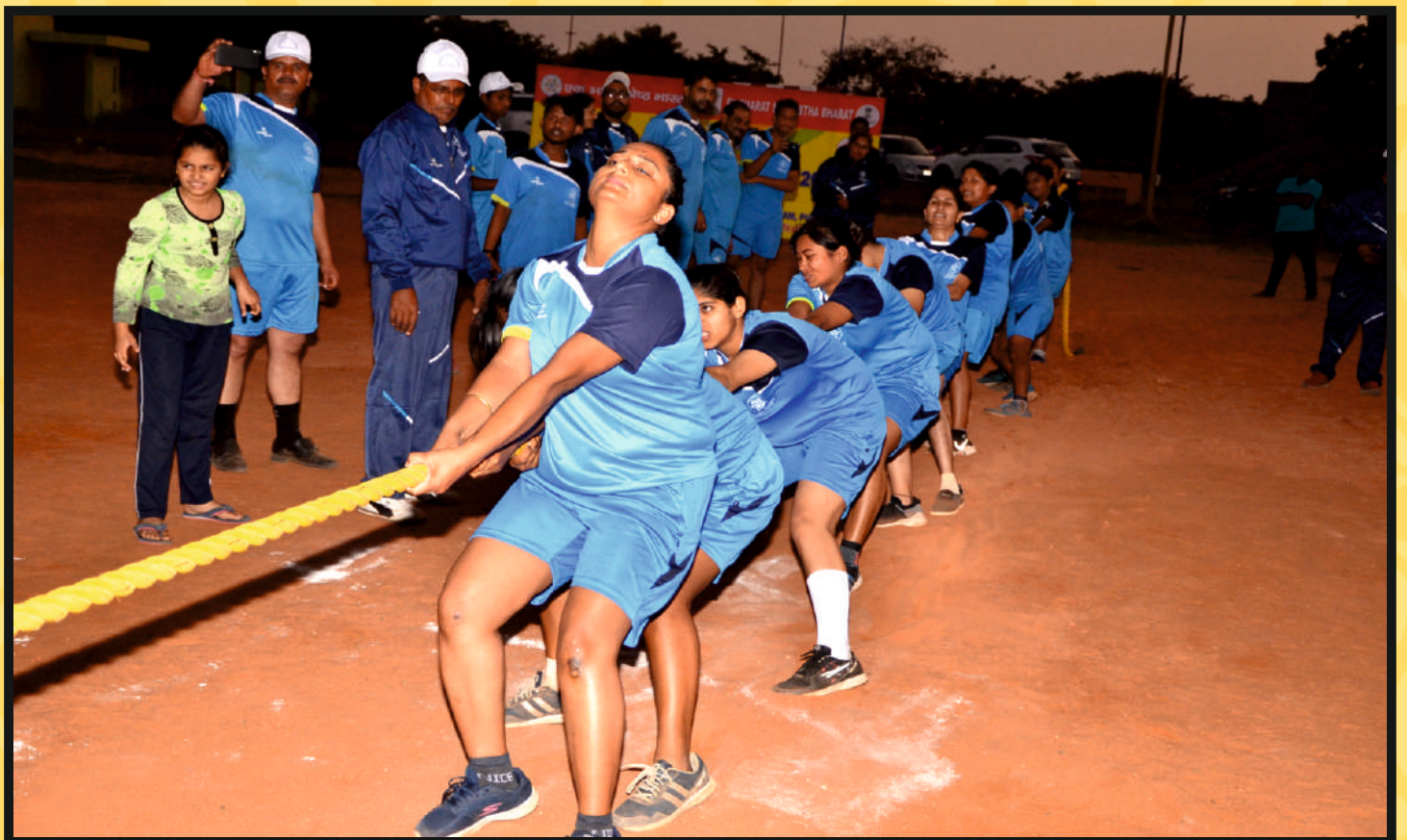
Rope Pull by Women Team of Rajasthan & Assam