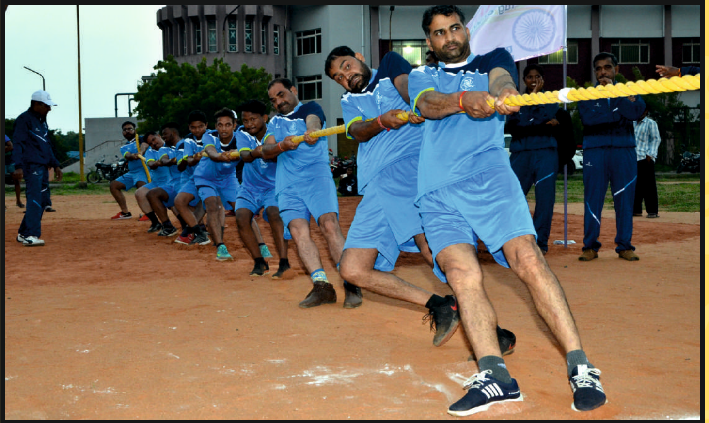
Rope Pull by Men Team of Rajasthan & Assam