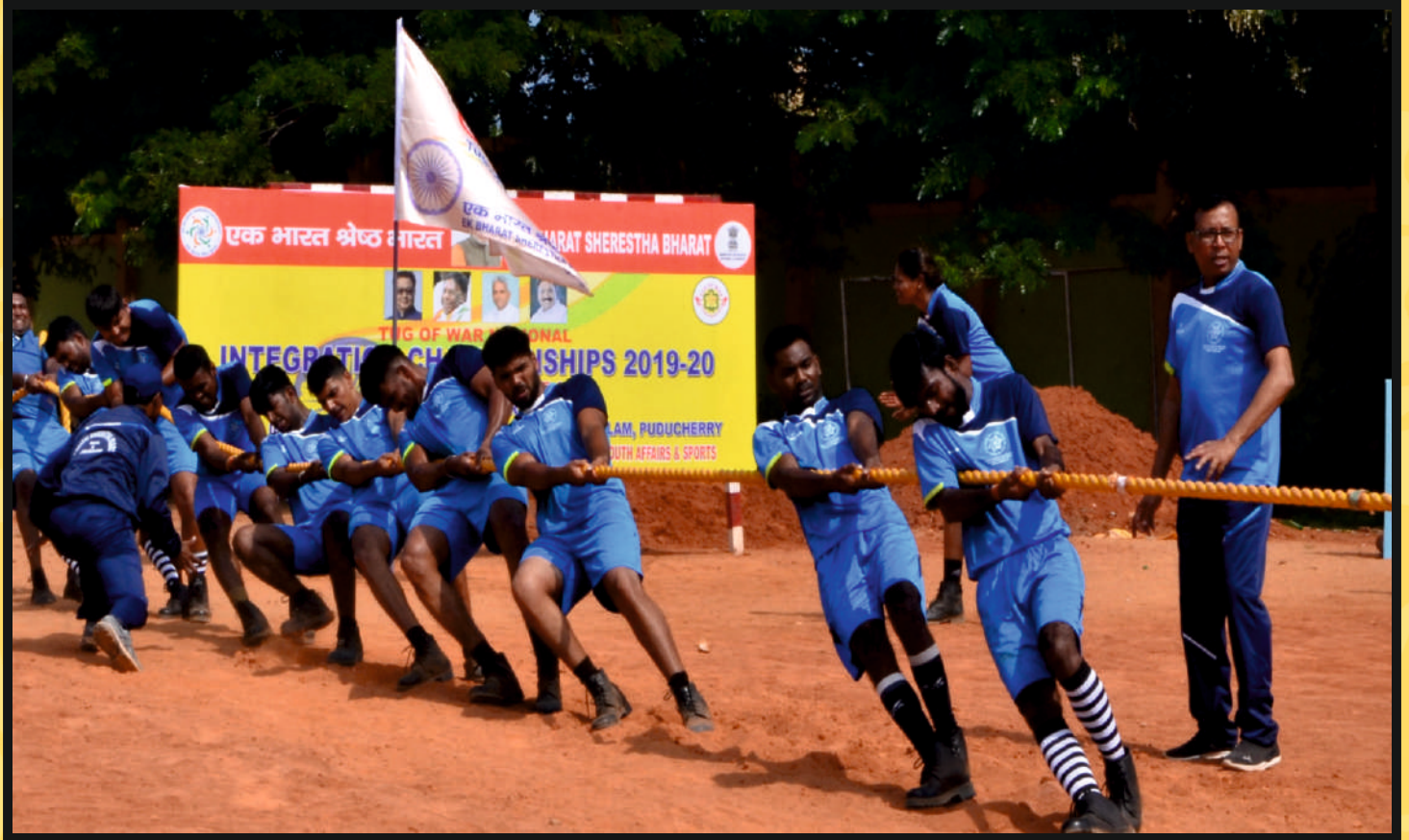
Rope Pull by Men Team of Goa & Jharkhand