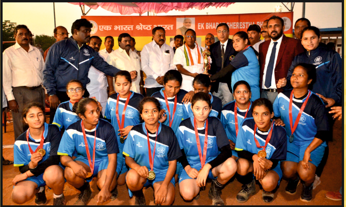
Hon'ble Chief Minister, Govt. of Puducherry Shri V.NARAYANASAMY Presented the Winner Trophy to Women Team of Punjab & Andhra Pradesh