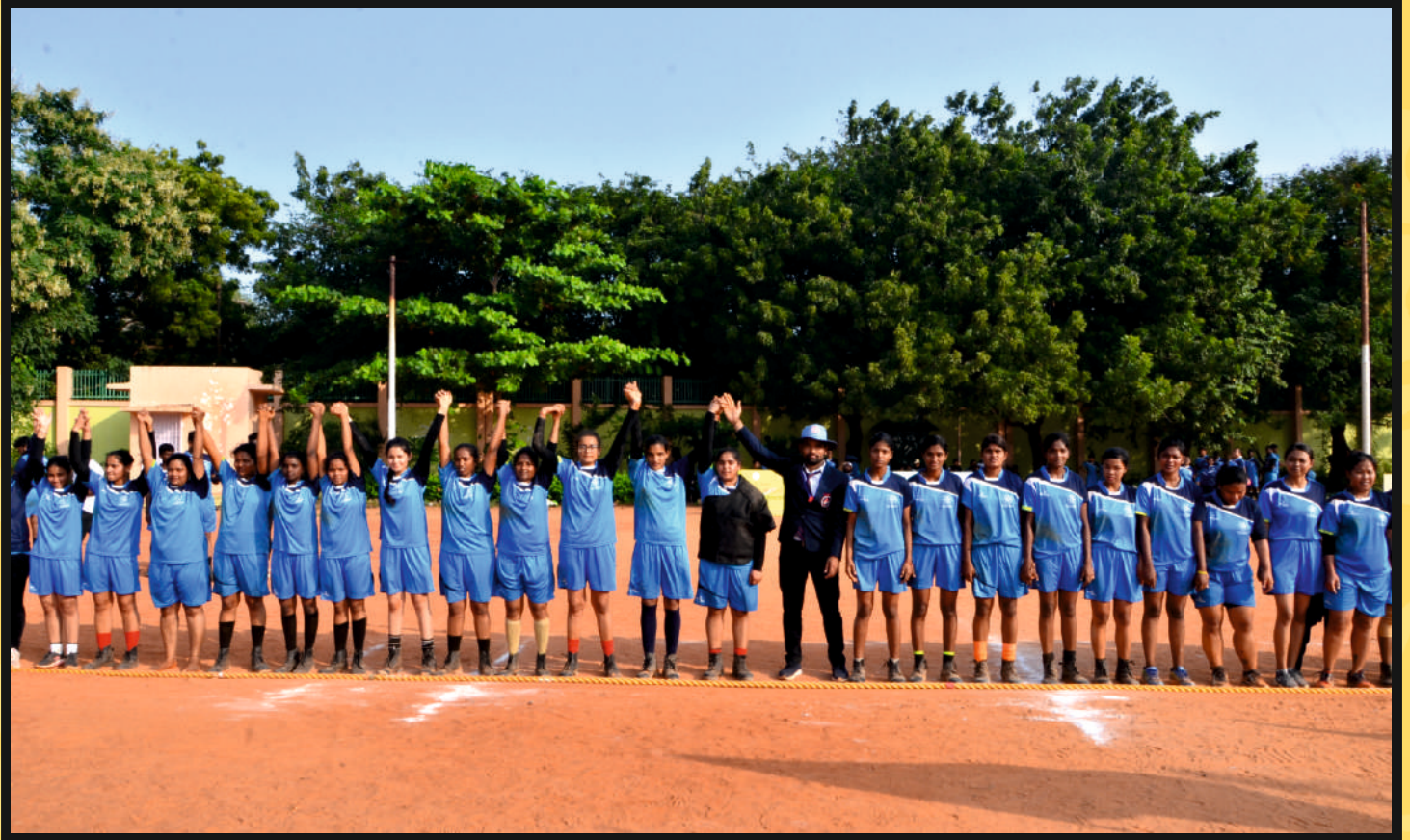
Picture shows Referee declare winning team of the Match L to R Punjab & AP with Lakshdweep & Andaman & Nicobar UT