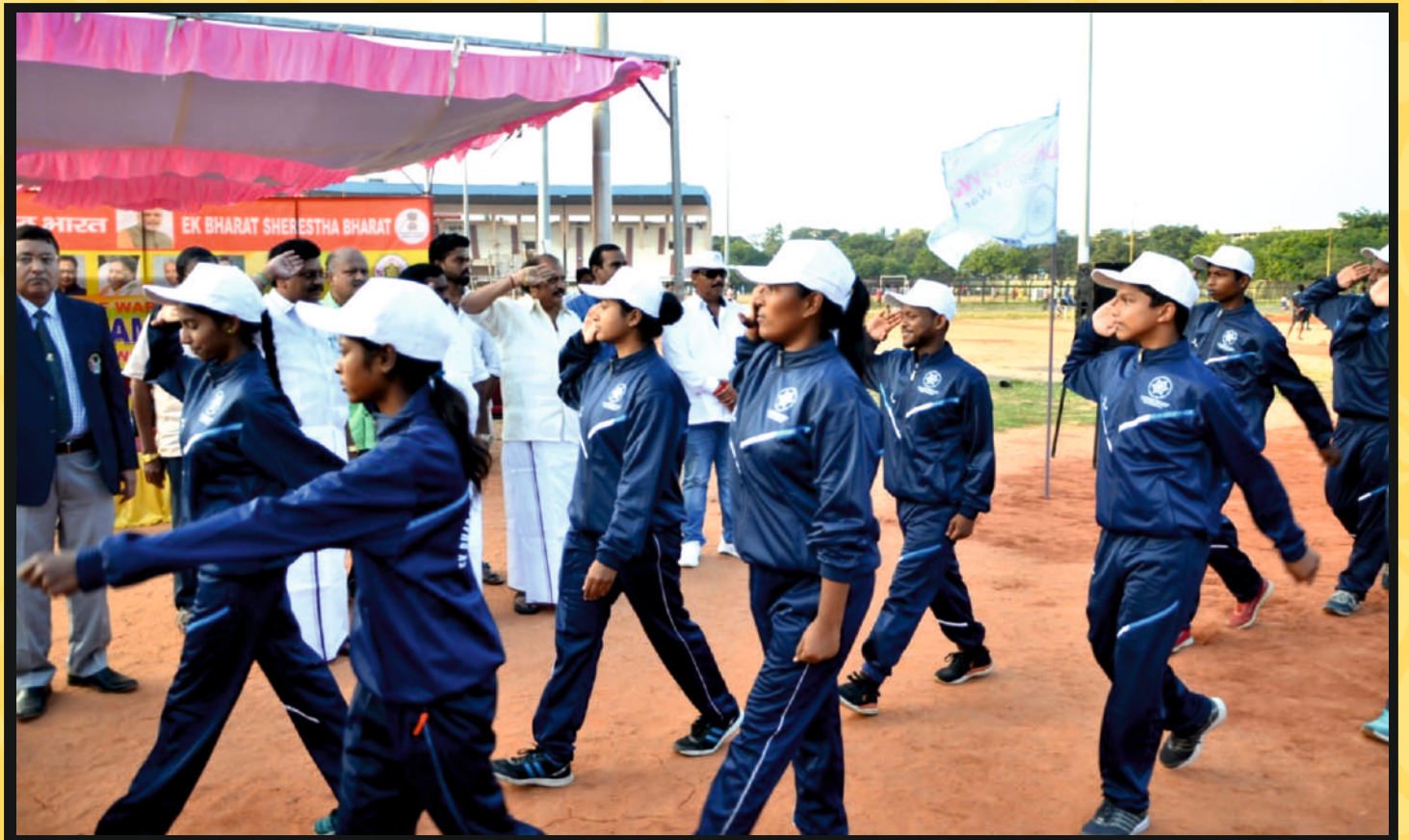
March-Past Continues by Women team